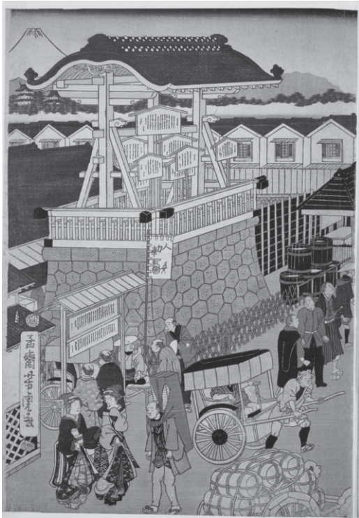
図 孟齋芳虎「東京 (カ) 風景(部分)」

サナエは幕府の改革を調べるなかで、明治時代に描かれた錦絵(図)を見つけ、簡単なメモを作った。